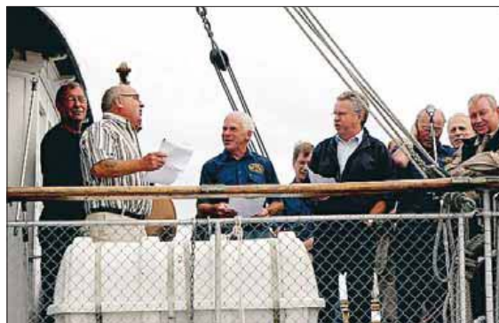
Takterna satt i oss veteranerna som i söndags, liksom för 30 år sedan, sjöng En gång jag seglar i hamn.