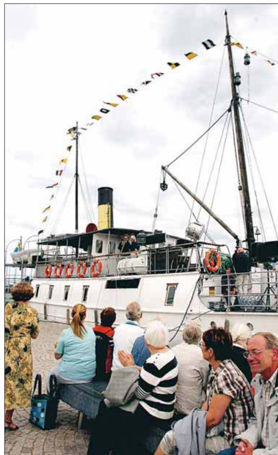
Dagen till ära hade Trafik utsmyckats med flaggor.